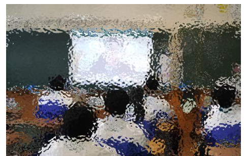
公立入試 事前指導(オンライン) 校長先生からの激励

保護者の皆様、地域の皆様には、今年度も本校の教育活動にご理解とご支援をいただき、ありがとうございました。職員一同心より感謝申し上げます。本年度の最後を締めくくるこの3月も、来年度へつなげるための充実した教育活動となるよう日々取り組んでいきます。学校は、毎年卒業生を送り出すとすぐに新入生を迎え入れ、新たな集団での学校生活が始まります。また、我々教職員も人事異動があり、本校の規模ですと多い年で10名近くの教職員が入替わりします。そんな中で更によりよい学校づくりのため、新たなメンバーで教育活動を行っていきます。来年度も職員一同、生徒一人一人に寄り添いながら成長に関わらせていただき、よりよい富士中学校となるよう努力してまいります。引き続きご協力、ご支援をよろしく願いいたします。1年間ありがとうございました。